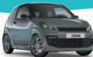
JS50L 502 Club

(5) DUE YOUNG Por 159 €/mes, entrada de 1.913,07 €, 35 cuotas de 159 € y una última cuota de 3.619,84 €.