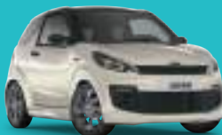
Blanco Nacarado Metalizado techo negro