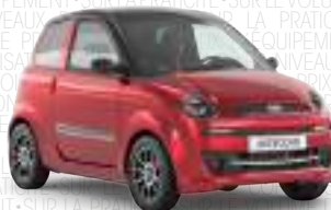
M.Go Dynamic Plus

(3) JS50L Club. P.V.P.: 12.490 € para particulares que entreguen un vehículo usado propiedad del comprador sobretasando en 1.500 € que se descontarán del P.V.P. Ligier Group de 13.990 € y unidades financiadas con Banco Cetelem, S.A. Sociedad Unipersonal. Ejemplo de financiación para 12.490 €. Entrada 3.276,25 €. Importe solicitado: 9.213,75 €. Importe total financiado: 10.155,27 € (incluida comisión de formalización de 3%; 276,41 € y seguro opcional de: 665,11 €). Importe mensualidad: 35 cuotas de 199 € y una última cuota de 5.029,4 €. Importe total adeudado: 11.994,4 €. Precio total a plazos: 15.270,65 €. TIN: 7,99%. TAE: 9,76%. Oferta financiera válida hasta el 31/08/2018. P.V.P. recomendado para el cliente que no financie 13.990 €.