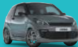
Gris Grafito Metalizado techo negro